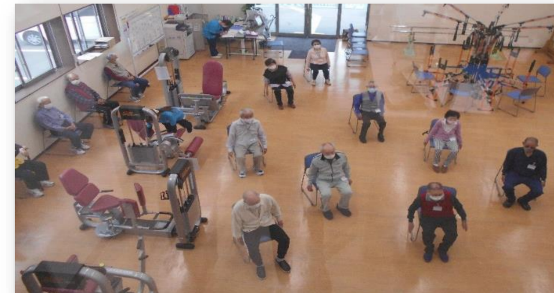
(フロア全体を活用した、集団体操の様子)