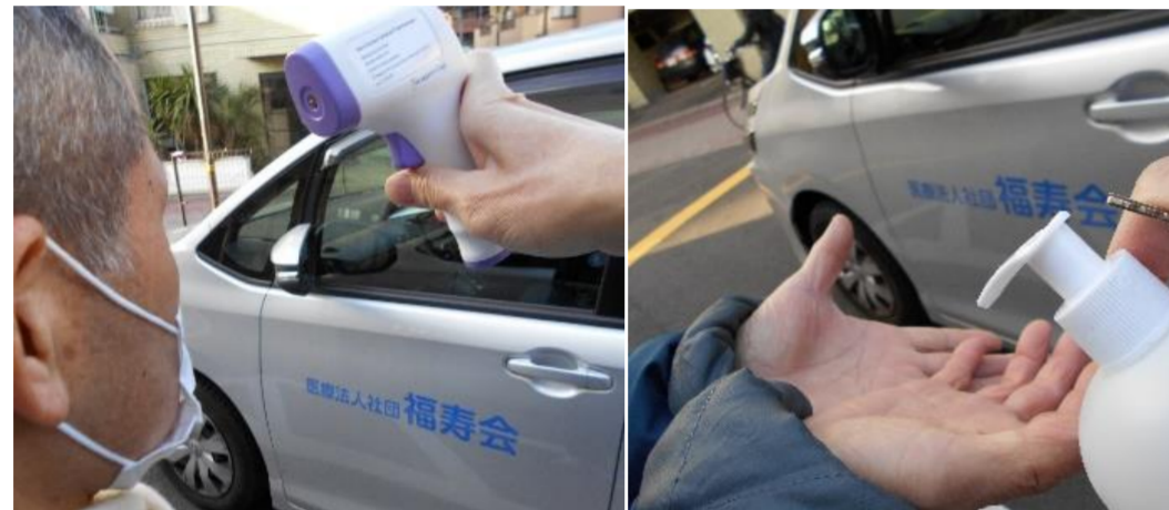
(乗車前に非接触体温計で検温と手指アルコール消毒)