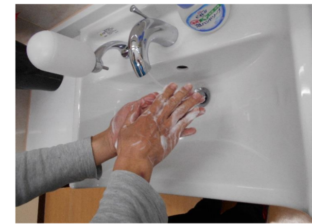
(洗面所にて石鹸で手洗い・アルコール消毒)